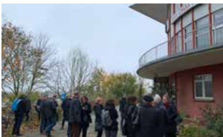
Schweriner Architektentreff am 11.11.19 vor der ehemaligen HO-Gaststätte „Panorama“ in Schwerin

R und 60 Kolleginnen und Kollegen sowie interessierte Gäste kamen zum Schweriner Architektentreff am 11.11.2019 in die ehemalige