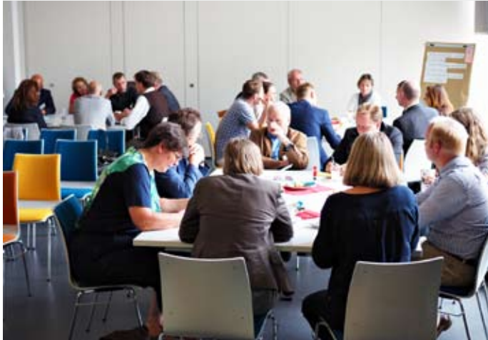
TeilnehmerInnen an den moderierten Werkstattgesprächen

völkerung als auch Kommunalverwaltungen und Genehmigungsbehörden in den Prozess enger einzubeziehen. Weitere Werkstattgespräche und Workshops sind dazu geplant.