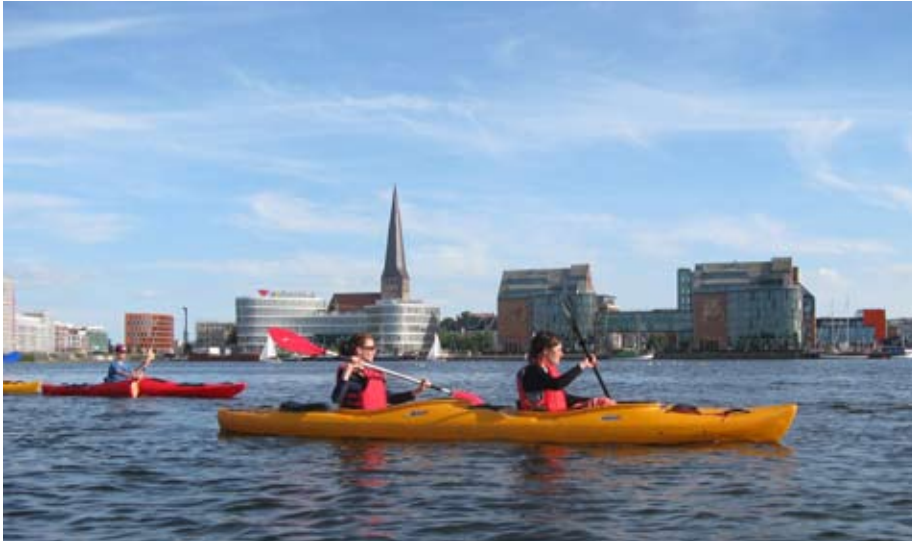
Neues Wohnquartier Holzhalbinsel (im Bau), Firmensitze von CENTOGENE (im Bau) und AIDA, bestehend aus Neubau und zeitgemäß ergänzten, historischen Speichern (v.l.n.r.)

wird. Einige der Objekte können als beispielhaft für zeitgemäße und qualitätvolle Architektur sowie Landschaftsarchitektur gelten.