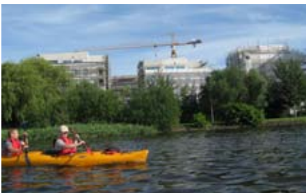
Neues Wohnquartier Holzhalbinsel (im Bau).