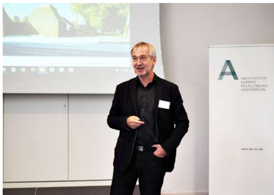
Joachim Brenncke, Präsident der Architektenkammer M-V erläutert den Sachstand von Baukultur und Tourismus auf Bundes- und Landesebene anhand prämiierter Architektur-Beispiele

Abschließend bleibt noch der Verweis auf die Agenda der Fortbildungsveranstaltungen für Architekten in Mecklenburg-Vorpommern am Ende dieses Regionalteils. ■