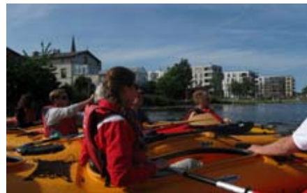
Uferpark und neue Wohnbebauung Petriviertel.