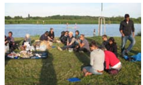
Picknick im Uferpark des Petriviertels.