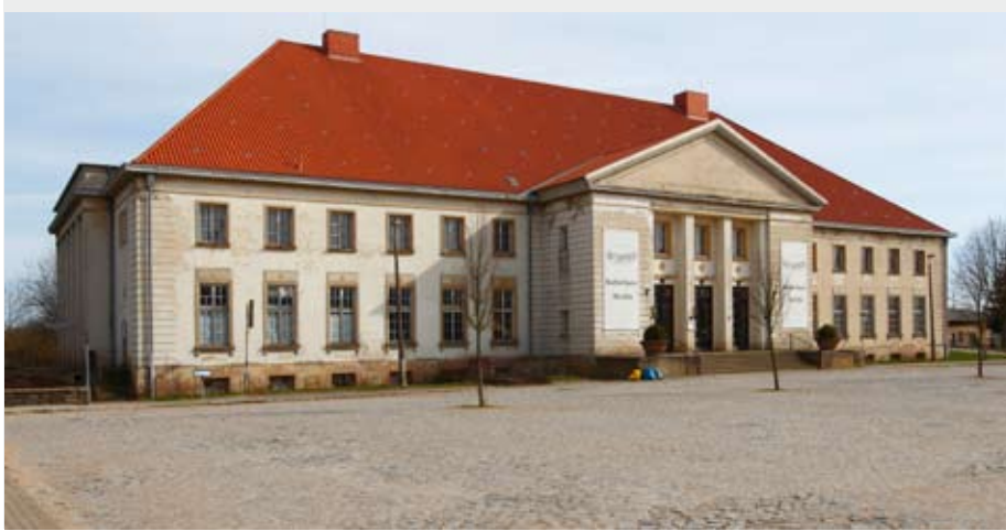
Kulturhaus Mestlin, eingeweiht 1957, ist Förderprojekt der Deutschen Stiftung Denkmalschutz

statt GmbH Greifswald sowie die neu gestaltete Dauerausstellung, konzipiert vom Architekturbüro Baldauf aus Schwerin. Beide Büros arbeiteten eng mit dem Restaurator Andreas Weiß aus Gingst zusammen. Drei Führungen erkunden die verschiedenen Ausdrucksweisen der Repräsentation: 11.15 Uhr: Der Luxusbau in der Granitz – Form und Funktion; 12.15 Uhr: Die Fürstlichen Salons im Jagdschloss; 13.15 Uhr: Jagd – Pracht und Macht. Die Teilnahme an den Führungen ist im Eintrittspreis enthalten.