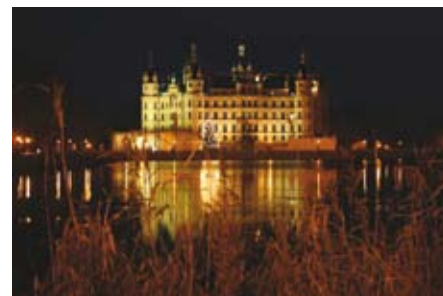
Schloss Schwerin, Sitz des Landtags M-V

Erfreulich im Sinne einer hohen Architek-